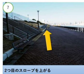
2つ目のスロープを上げる