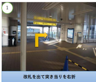
改札を出て突き当りを右折