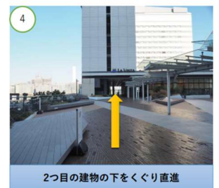
2つ目の建物の下をくぐり直進