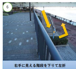
右手に見える階段を下りて左折