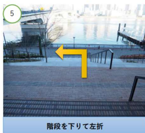
階段を下りて左折