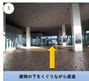
建物の下をくぐりながら直進