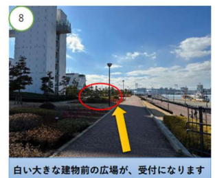
白い大きな建物前の広場が、受付になります