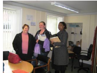
立ち寄りサービスを行うRCスタッフ