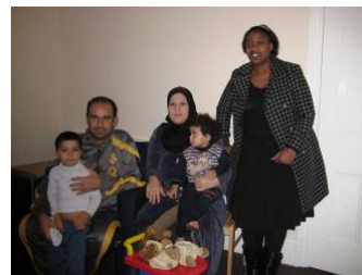
イラク難民家族の家庭訪問を行うRCスタッフ