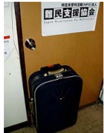
事務所の入口に置かれた難民の荷物

またこの間、空港から入国が許可されず、庇護希望を訴える方からの問い合わせが複数ありました。また大阪の茨木市にある入管施設（西日本入国管理センター）に収容されている方からの電話による問い合わせが増え、15件に達しています。